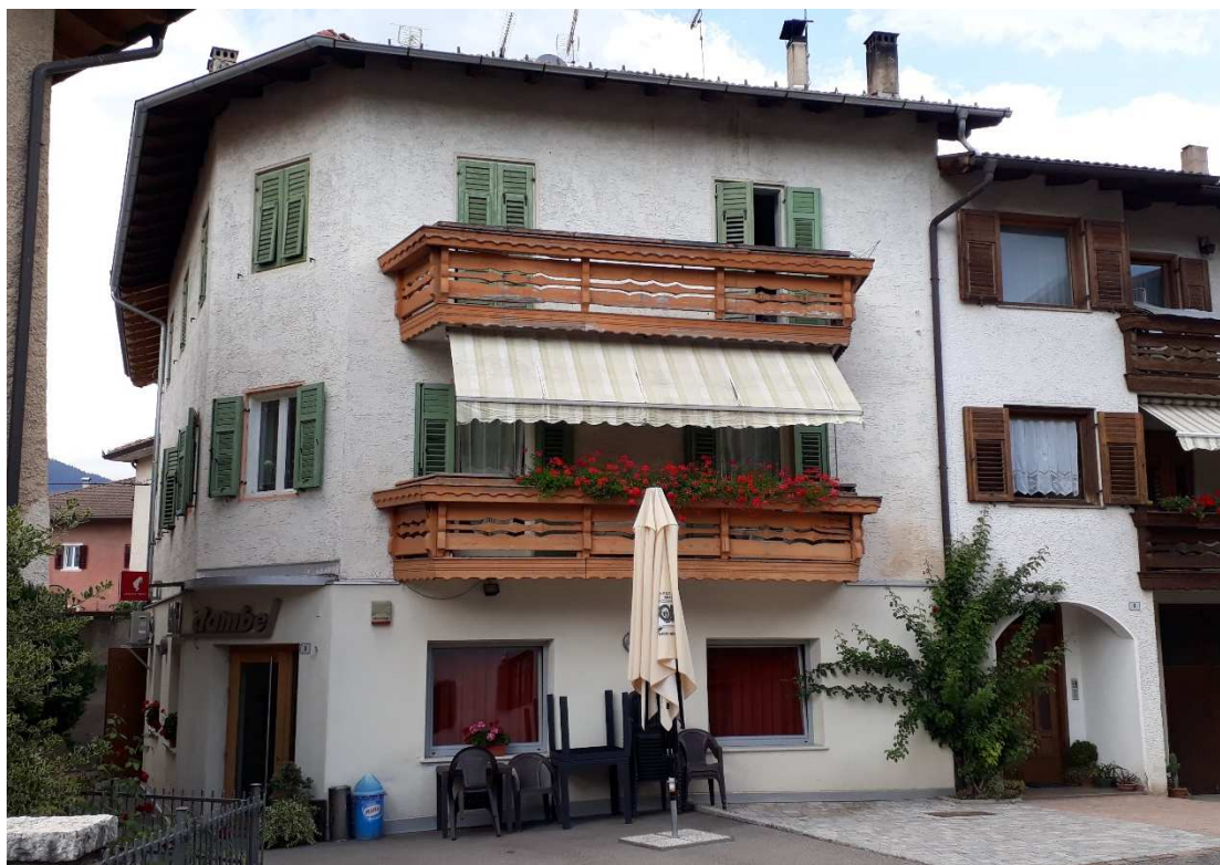
Vista da sud